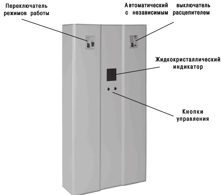
Рис. 1. Стабилизатор напряжения

В верхней части расположен клеммник, для подключения стабилизатора, закрытый крышкой. Там же расположен заземляющий контакт.