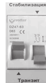
Рис. 8. Режим «Транзит»