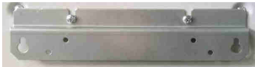
Рис. 2 Крепежная планка

Для размещения стабилизатора на стене сначала монтируется крепежная планка (Рис.2), потом на нее подвешивается аппарат и производится подключение токоведущих проводников. Упорная планка на стабилизатор установлена с завода (Рис.3).