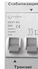
Рис. 7. Отключены оба режима.

В режиме «Транзит» на выход стабилизатора подается нескорректированное входное напряжение, но и в этом режиме обеспечивается защита от перенапряжения на уровне 260 \pm 5\text{В} .