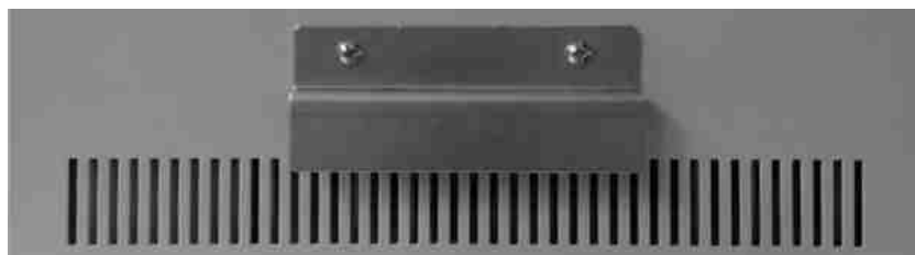
Рис. 3 Упорная планка