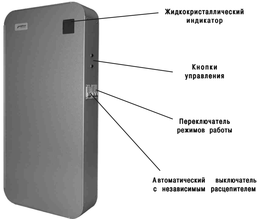
Рис. 16. Стабилизатор напряжения Smart-9, Smart-11, Smart-14.