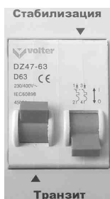
Рис. 6 Режим «Транзит».

При входном напряжении более 260 \pm 5\text{В} в режиме «Транзит» срабатывает автоматический выключатель стабилизатора. Повторное включение возможно только взведением автоматического выключателя во включенное состояние. Если входное напряжение при этом осталось выше 260 \pm 5\text{В} , произойдет повторное отключение, что защитит нагрузку от перенапряжения.