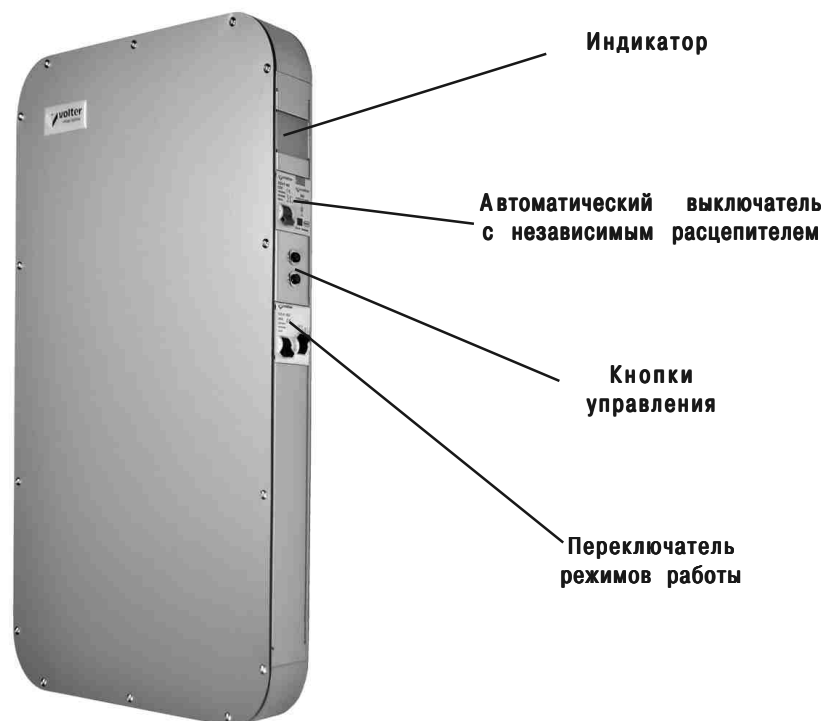
Рис. 1а. Стабилизатор напряжения Smart-4, Smart-5, Smart-7.

Жидкокристаллический индикатор показывает уровень входного и выходного напряжения и нагрузку* в процентах (*кроме моделей Smart-4, Smart-5, Smart-7). На боковой панели стабилизатора расположены автоматический выключатель с независимым расцепителем, переключатель режимов работы «Стабилизация-Транзит» и кнопки управления.