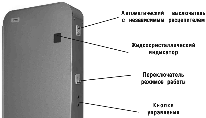
Рис. 1в. Стабилизатор напряжения Smart-18, Smart-22, Smart-27.