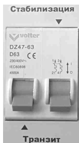
Рис. 5 Отключены оба режима.

При неисправностях стабилизатора необходимо обращаться в сервисный центр, так как стабилизатор не рассчитан на самостоятельный ремонт пользователем.