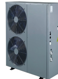
Altek Total 15-21