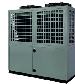
Altek Total 32-72