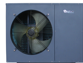
Altek Total 7