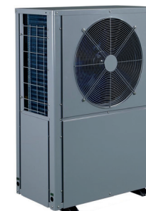
Altek Total 9-10