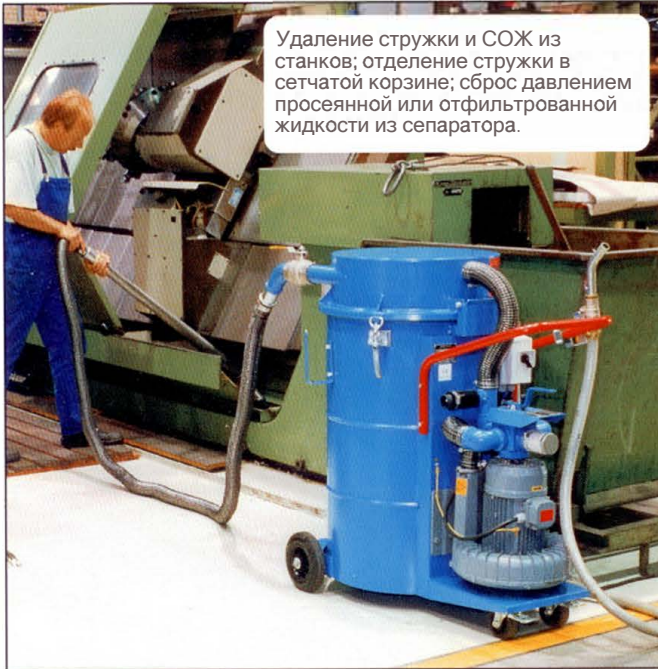
Удаление стружки и СОЖ из станков; отделение стружки в сетчатой корзине; сброс давлением просеянной или отфильтрованной жидкости из сепаратора.