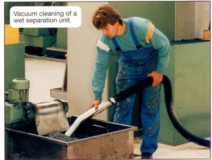
Vacuum cleaning of a wet separation unit