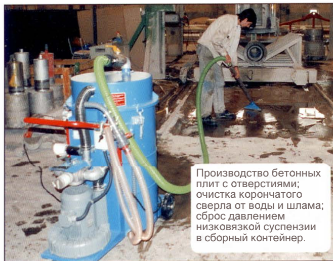
Производство бетонных плит с отверстиями; очистка корончатого сверла от воды и шлама; сброс давлением низковязкой суспензии в сборный контейнер.