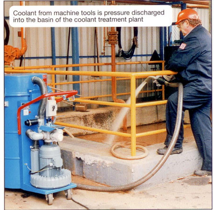
Coolant from machine tools is pressure discharged into the basin of the coolant treatment plant