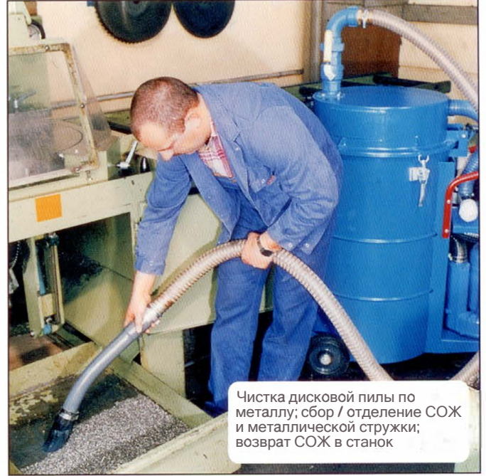
Чистка дисковой пилы по металлу; сбор / отделение СОЖ и металлической стружки; возврат СОЖ в станок