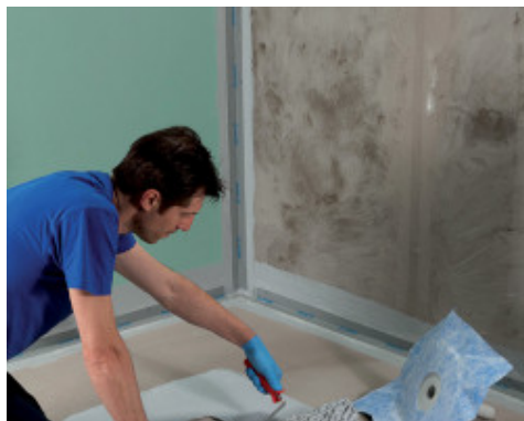
Приклеивание Drain Vertical с помощью Mapegum WPS