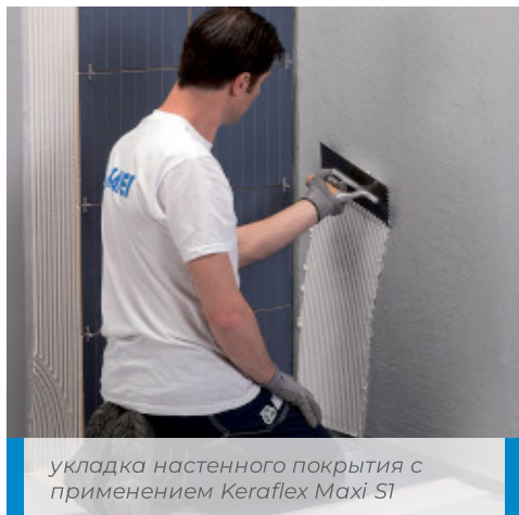
укладка настенного покрытия с применением Keraflex Maxi S1