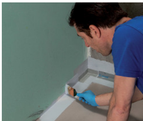
Приклеивание Mapeband PE 120 с применением Mapegum WPS