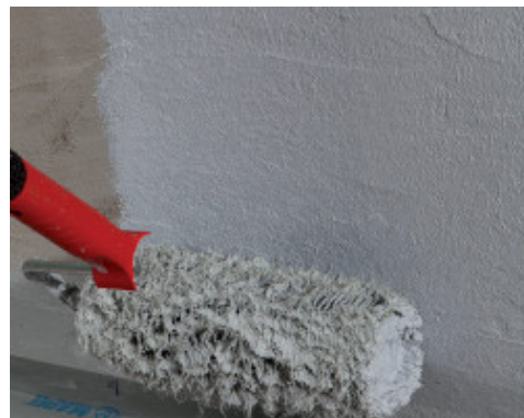
Нанесение Mapegum WPS валиком