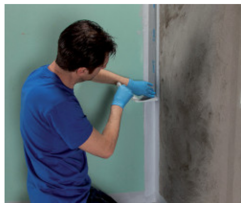
Приклеивание Mapeband PE 120 с применением Mapegum WPS