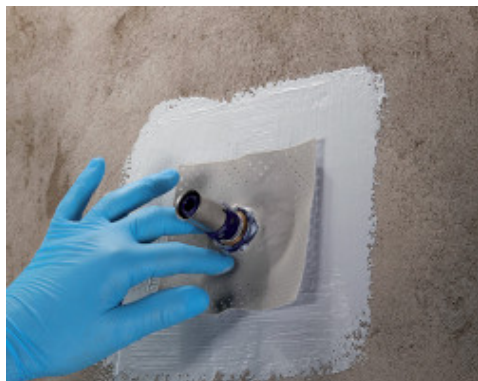
Приклеивание Mapeband PE 120 для сквозных отверстий с помощью Mapegum WPS