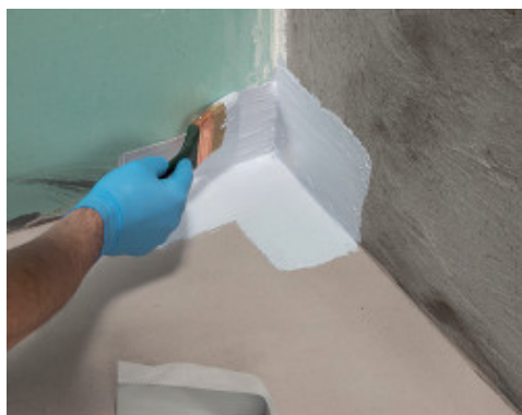
Приклеивание углового элемента Mapeband PE 120 90° с применением Mapegum WPS

Компенсационные швы следует заполнить специальными герметиками производства компании MAPEI.