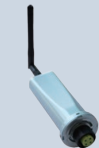
Пристрій реєстрації даних WiFi

GPRS-зв'язок, що дозволяє здійснювати мобільний моніторинг у будь-який час і у будь-якому місці