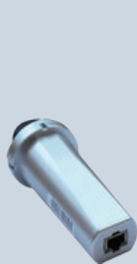
Пристрій реєстрації даних LAN