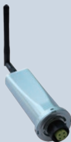
Пристрій реєстрації даних GPRS