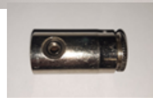
Рис. 1 Пример соединения шланга, соединителя и форсунки.