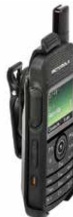
Крепление для переноски радиостанции

Наше многоместное зарядное устройство настолько мощное, что оно позволяет одновременно заряжать 6 радиостанций или батарей. Это устройство отличается высокой функциональностью и небольшими размерами.