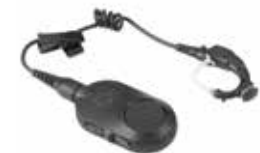
Беспроводной наушник Operations Critical

«Когда я впервые увидел радиостанцию MOTOTRBO серии SL4000, я подумал, что это мобильный телефон, а не радиостанция двусторонней радиосвязи. Она обладает всеми функциями радиостанции двусторонней радиосвязи, и по своему внешнему виду предназначена для профессиональных целей. Она прекрасно подходит для всех видов нашей форменной одежды».