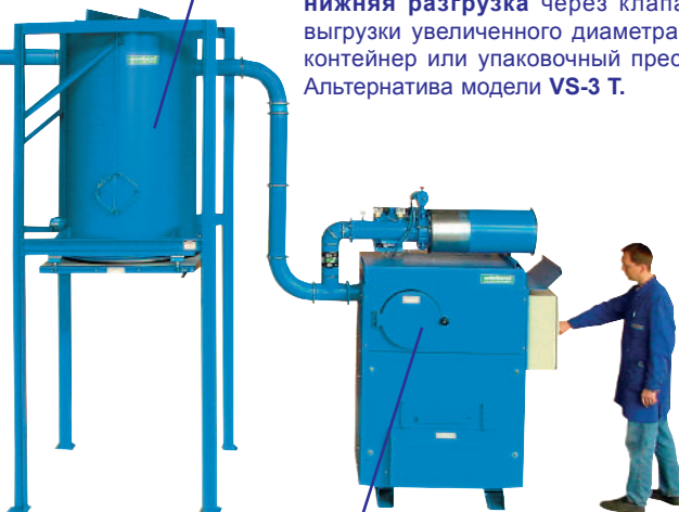
Вакуумный агрегат, модель KS-220, 22 кВт

Сепаратор отходов текстильного производства, модель TEX-1000, нижняя разгрузка через клапан выгрузки увеличенного диаметра в контейнер или упаковочный пресс. Альтернатива модели VS-3 T.