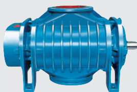
Ротационный вакуумный насос Максимальный вакуум 50 или 80 %

Не имеет изнашивающихся частей, является источником вакуума в передвижных пылесосах.