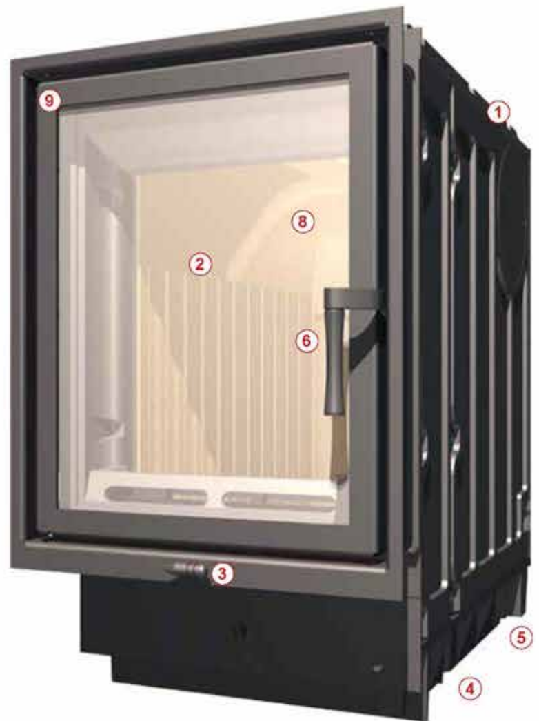
Печные топки Olsberg