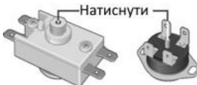
Малюнок 3. Схема розташування кнопки термовимикача

Перераховані вище несправності не є дефектами ЕВН і усуваються споживачем самостійно або за його рахунок.