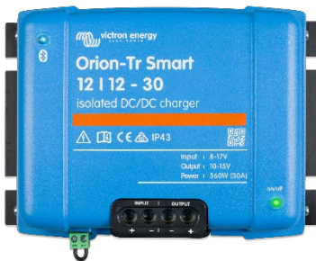
Orion-Tr Smart 12/12-30