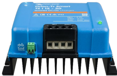
Orion-Tr Smart 12/12-30