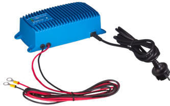
Зарядное устройство Blue Smart IP67 12/25