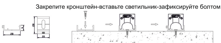
Размеры монтажного кронштейна