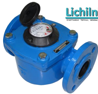
Рис. 2 Лічильник води JS