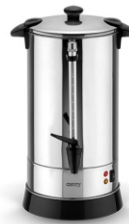
Electric Boiler CR 1267