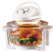
Halogen Oven CR 6305