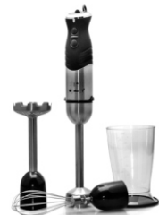
Hand blender CR 4612