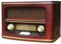
Retro Radio CR 1103