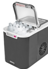
Ice Cube Maker CR 8073