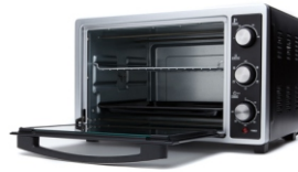
Electric Oven CR 6018