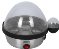
Egg Boiler CR 4482