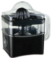
Citrus juicer CR 4001