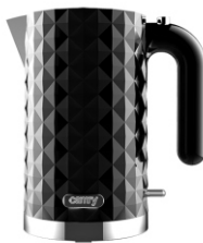
Electric Kettle CR 1269