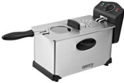
Deep Fryer CR 4909