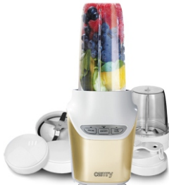
Personal Blender CR 4071