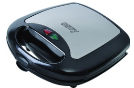
Electric Grill CR 3024