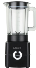
Blender CR 4050