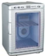
Mini-fridge CR 8062