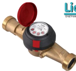
Рис. 2 Лічильник води JS130