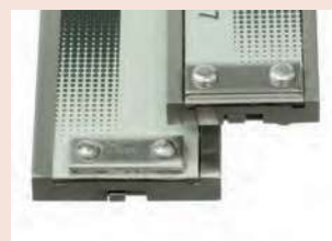
Штанга 150 и 200 мм или 300 мм