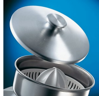
Lid - optional