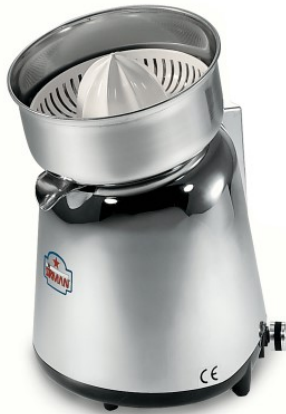
Sirman Соковыжималки , model Apollo :

Sirman Spa Viale dell'Industria 9/11 35010 PIEVE DI CURTAROLO (PD), Italy Tel./Fax. +39 049 9698666 / +39 049 9698688 email: info@sirman.com