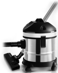
Canister vacuum cleaner AD 7022