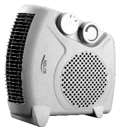
Fan heater AD 77