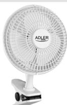
Desk fan 15 cm with clip AD 7317