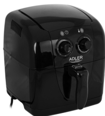
Air fryer AD 6307