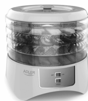
Food dryer AD 6654