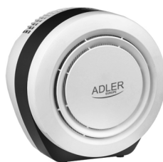
Air Purifier AD 7961