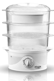
Steam cooker AD 633