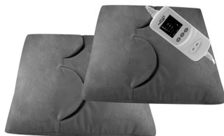
Electric heating pad AD 7403