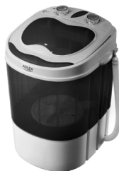
Mini washing machine with spinning function AD 8051