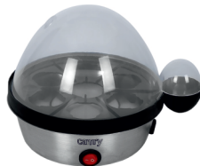
Egg Boiler CR 4482