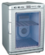
Mini-fridge CR 8062