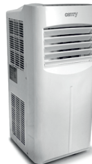
Air conditioner CR 7902