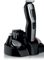
FACIAL TRIMMER CR 2921