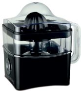
Citrus juicer CR 4001