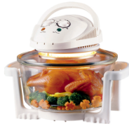
Halogen Oven CR 6305