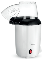
Popcorn maker CR 4458