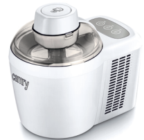
Ice Cream Maker CR 4481