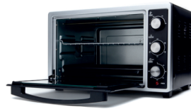
Electric Oven CR 6018