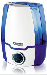
Air humidifier CR 7952