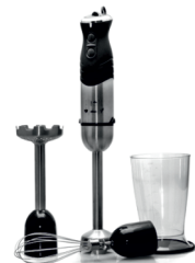
Hand blender CR 4612