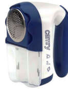
Lint remover CR 9606