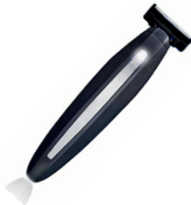
DUAL BLADE TRIMMER CR 2922