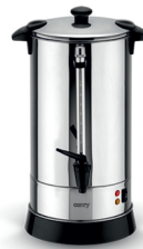
Electric Boiler CR 1267