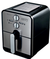
Air fryer CR 6306