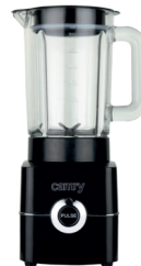
Blender CR 4050