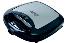
Electric Grill CR 3024