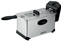
Deep Fryer CR 4909