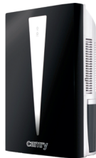
Air dehumidifier CR 7903