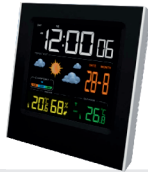
Weather Station CR 1166