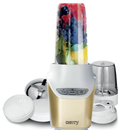
Personal Blender CR 4071