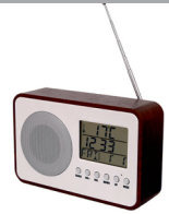
Radio CR 1153