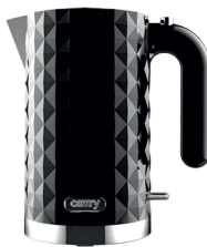
Electric Kettle CR 1269