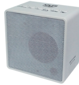
Cube Radio CR 1165