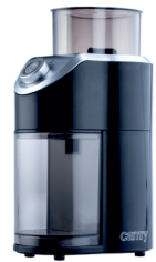
Burr Coffe Grinder CR 4439