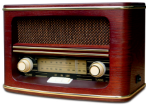
Retro Radio CR 1103