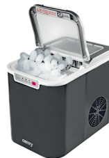
Ice Cube Maker CR 8073