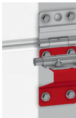
Кронштейн боковой для промышленных ворот