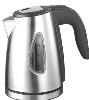
Kettle AD 1203