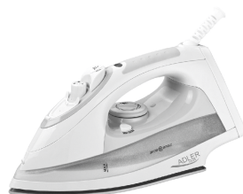
Steam Iron AD 5014