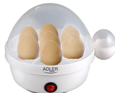
Egg Boiler AD 4459