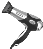
Hair Dryer AD 2224