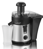
Juice Extractor AD 4106