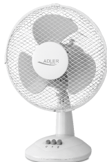
Table Fan AD 7302