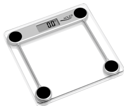
Bathroom Scale AD 8121