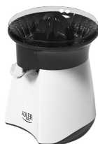
Citrus Juicer AD 4005