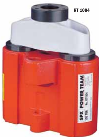
ASME B30.1 700 бар

Идеально подходят для вытягивания и натяжения