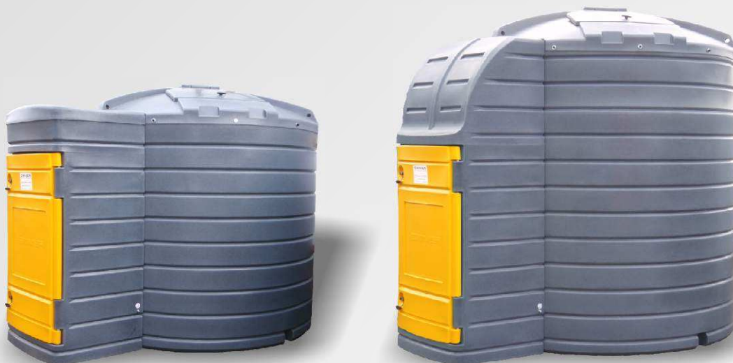
SWIMER TANK 7500 FUDPS SW-101077

Высота: 2100 мм Диаметр: 2360 мм Длина: 3100 мм