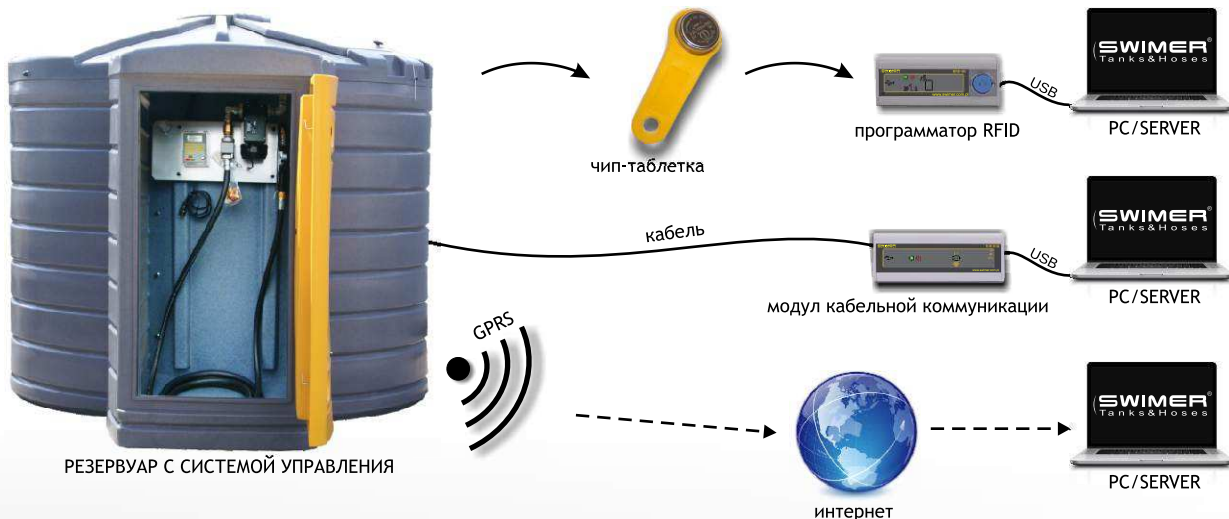
РЕЗЕРВУАР С СИСТЕМОЙ УПРАВЛЕНИЯ

Простой метод переноса данных из контроллера в компьютер/сервер посредством чип-таблетки, по кабелю или GPRS.