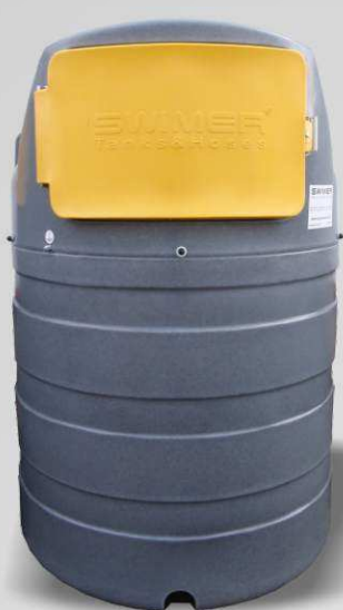
SWIMER TANK 1500 ELDPS SW-101783