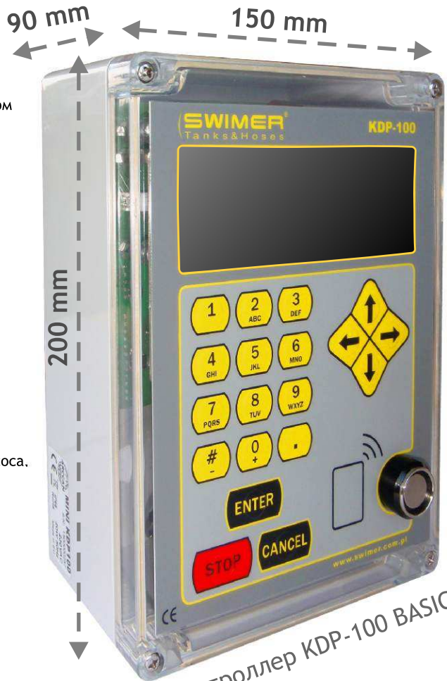
Контроллер KDP-100 BASIC

Простой метод переноса данных из контроллера в компьютер/сервер посредством чип-таблетки, по кабелю или GPRS.