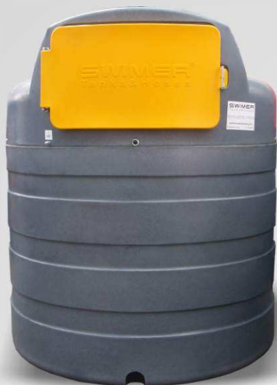
SWIMER TANK 2500 ELDPS SW-101784