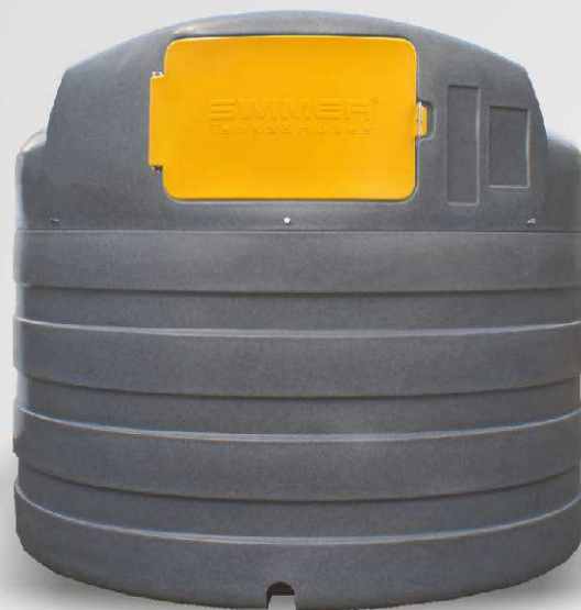
SWIMER TANK 5000 ELDPS SW-101925