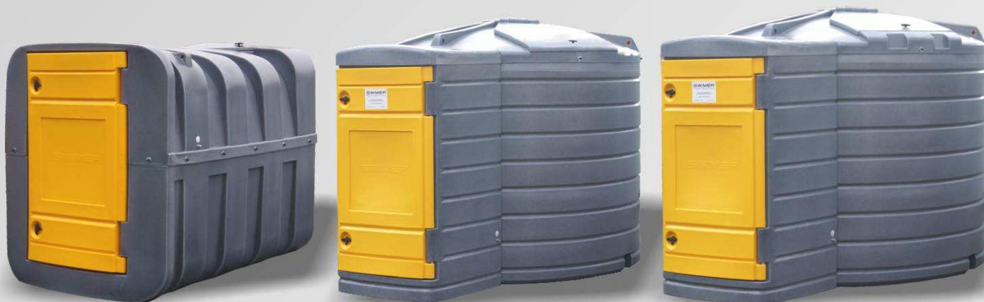
SWIMER TANK 2500 FUDPS SW-101172

Высота: 1800 мм Ширина: 1500 мм Длина: 2540 мм