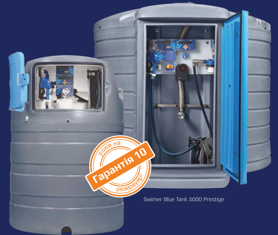
Swimer Blue Tank 5000 Prestige