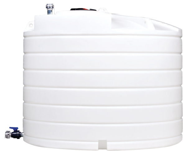
Swimer Water Tank 5000