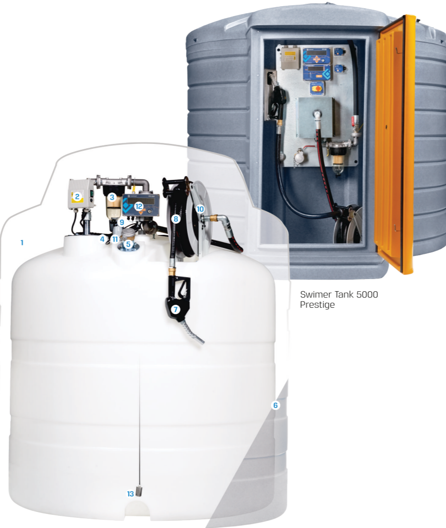
Swimer Tank 5000 Prestige