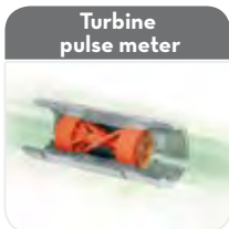
Turbine pulse meter