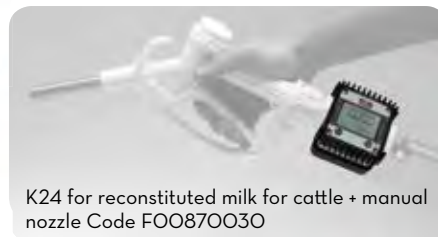
K24 for reconstituted milk for cattle + manual nozzle Code F00870030