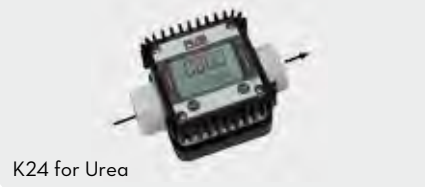
K24 for Urea