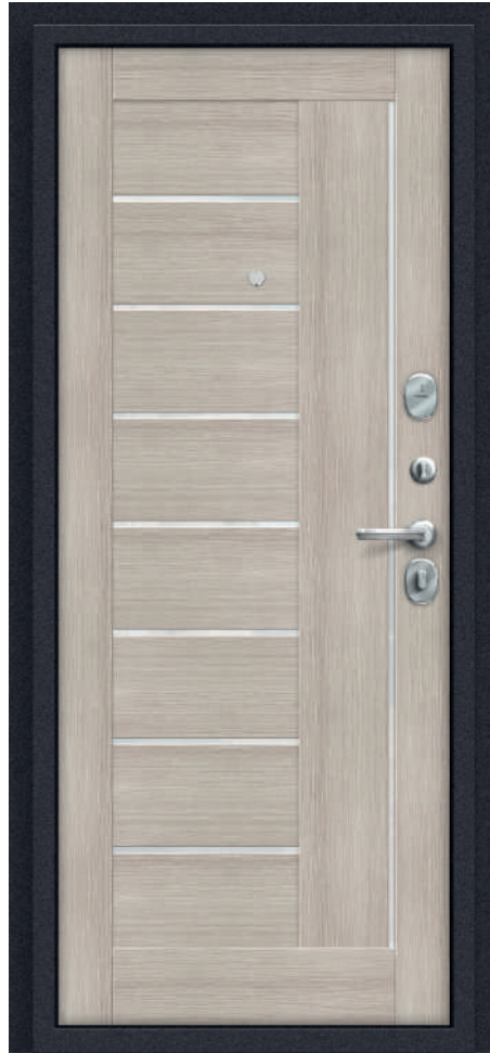
П29. Cappuccino Veralinga

Стандартний розмір, мм: 88x2050, 98x2050