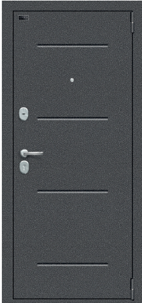
104. Антік Срібло WW