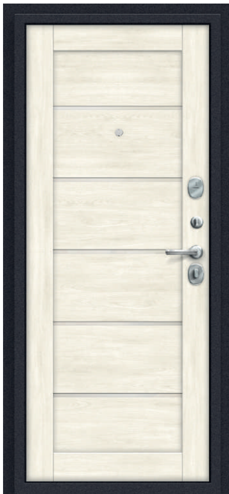
Л22. Nordic Oak

Стандартний розмір, мм: 88x2050, 98x2050