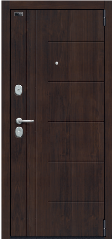
9. Almon 28WP