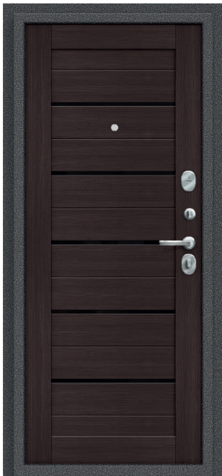
П22. Wenge Veralinga

Стандартний розмір, мм: 88x2050, 98x2050