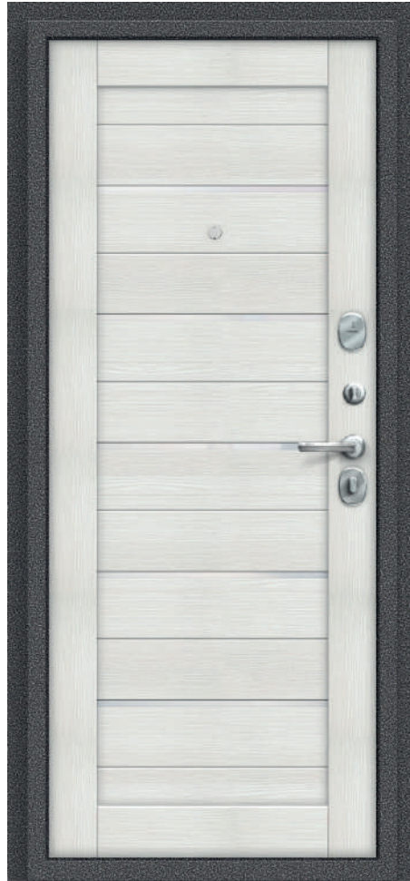
П22. Bianco Veralinga

Стандартний розмір, мм: 88x2050, 98x2050