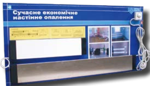
Діючий стенд-макет "Сучасне економічне настінне опалення"