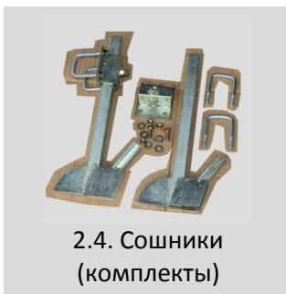
2.4. Сошники (комплекты)