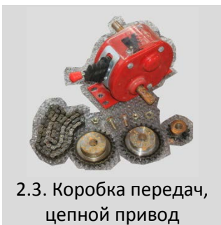
2.3. Коробка передач, цепной привод