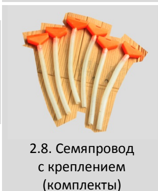
2.8. Семяпровод с креплением (комплекты)

Примечание: элементы комплектов могут находиться в разных упаковках, поэтому для удобства сборки комплекты рекомендуется рассортировать и сложить по принадлежности в одном месте.