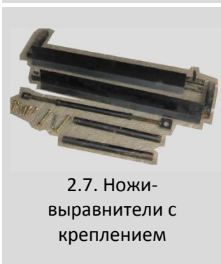
2.7. Ножи-выравниватели с креплением