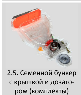
2.5. Семенной бункер с крышкой и дозатором (комплекты)