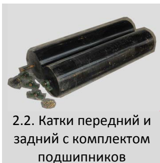
2.2. Катки передний и задний с комплектом подшипников