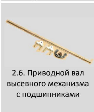
2.6. Приводной вал высевного механизма с подшипниками