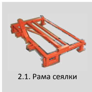
2.1. Рама сеялки

2. Комплектующие узлы и детали сеялки. Количество высевных аппаратов и их составляющих, а также ассортимент крепежных элементов, зависит от конкретной модели.