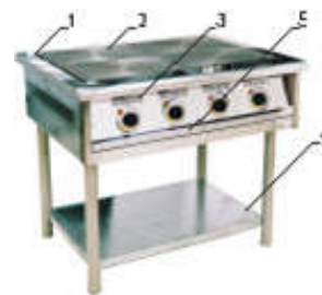
Рис. 1 Плита ПЕ-4

1 – корпус; 2 – конфорки; 3 - панель управління; 4 – підставка з полицею; 5- піддон