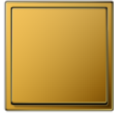
LS 990 Золото металл с покрытием чистым золотом (24 карата) Угол закругления R 2