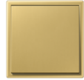
LS 990 Латунь Classic CuZn37, кварцевание щёткой, грануляцией 240, двустороннее покрытие прозрачным лаком (антикоррозийная защита)