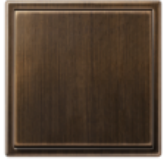
LS 990 Латунь Antik CuZn37, шлифование с грануляцией 240, оксидирование поверхности, полирование с грануляцией 180, покрытие прозрачным лаком (антикоррозийная защита)