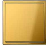
LS 990 имитация золота PVD-покрытие под золото Угол закругления R 2