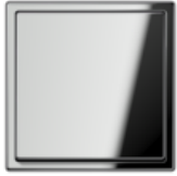
LS 990 Блестящий хром хромированный металл Угол закругления R 2

стеклянными шариками Угол закругления R 2