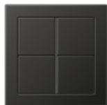
FLAT DESIGN in Anthracite Varnished aluminium Edge radius R 1.5