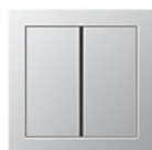
F40 Двухклавишный сенсорный переключатель В зависимости от назначения, можно выбрать крышки с нейтральной поверхностью, напечатанными символами или кнопками, на которых можно делать надписи.