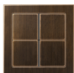
FLAT DESIGN in Antique brass CuZn37 brushed with 240 granulation, black-oxide finished, brushed with 2nd 180 granulation, varnish on both sides (anticorrosive coating)