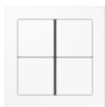
FLAT DESIGN in white