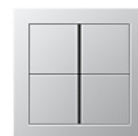
F40 Четырехклавишный сенсорный переключатель В зависимости от назначения, можно выбрать крышки с нейтральной поверхностью, напечатанными символами или кнопками, на которых можно делать надписи.