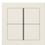
FLAT DESIGN in ivory