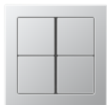
FLAT DESIGN in Aluminium AlMg1 Natural tone, matt finish Edge radius R 1.5