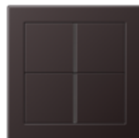
FLAT DESIGN in dark lacquered aluminium Edge radius R 1.5