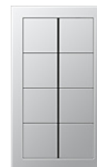
F40 Восьмиклавишный сенсорный переключатель В зависимости от назначения, можно выбрать крышки с нейтральной поверхностью, напечатанными символами или кнопками, на которых можно делать надписи.