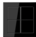
FLAT DESIGN in black