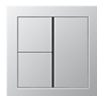
F40 Трехклавишный сенсорный переключатель В зависимости от назначения, можно выбрать крышки с нейтральной поверхностью, напечатанными символами или кнопками, на которых можно делать надписи.