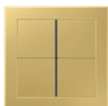
FLAT DESIGN in Classic brass CuZn37 plain brushed, 240 granulation Varnish on both sides (anticorrosive coating)