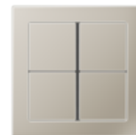
FLAT DESIGN in Stainless Steel 1.4303 X4CrNi18-12 glassball blasted Edge radius R 1.5