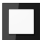
A CREATION in black Safety glass Edge radius R 1.25