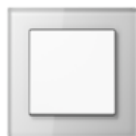
A CREATION in white Safety glass Edge radius R 1.25