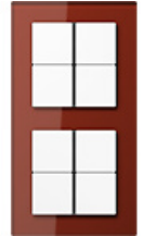
F40 Восьмиклавишный сенсорный переключатель В зависимости от назначения, можно выбрать крышки с нейтральной поверхностью, напечатанными символами или кнопками, на которых можно делать надписи.