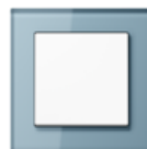
A CREATION in blue-grey Safety glass Edge radius R 1.25