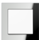
A CREATION in silver (mirror finish) Safety glass Edge radius R 1.25