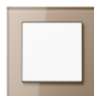
A CREATION in champagne Safety glass Edge radius R 1.25