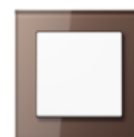
A CREATION in mocha Safety glass Edge radius R 1.25