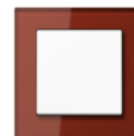
A CREATION in red Safety glass Edge radius R 1.25