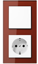
Сочетание переключателя-штепсельного гнезда из "A CREATION"