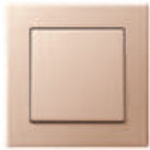
A CREATION in champagne Edge radius R 1.25