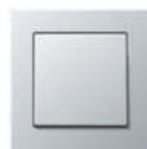
A CREATION in aluminium Edge radius R 1.25