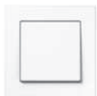
A CREATION in white similar RAL 9016 Edge radius R 1.25

Узнать подробнее о размерах, материалах и цветах: Скачать PDF документацию