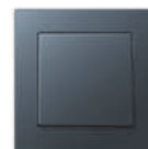
A CREATION in matt anthracite Edge radius R 1.25