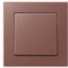
A CREATION in mocha Edge radius R 1.25