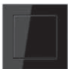
A CREATION in black similar RAL 9005 Edge radius R 1.25