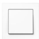
A CREATION in white similar RAL 9016 Edge radius R 1.25

Узнать подробнее о размерах, материалах и цветах: Скачать PDF документацию