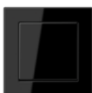
A CREATION in black similar RAL 9005 Edge radius R 1.25