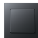
A CREATION in matt anthracite Edge radius R 1.25