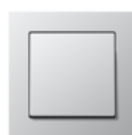
A CREATION in aluminium Edge radius R 1.25