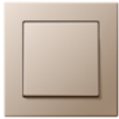
A CREATION in champagne Edge radius R 1.25