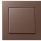
A CREATION in mocha Edge radius R 1.25