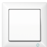
AS 500 ANTIBACTERIAL in white antibacterial duroplastic similar RAL 9010 Edge radius R 3,1