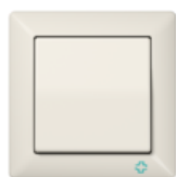
AS 500 ANTIBACTERIAL in ivory antibacterial duroplastic similar RAL 1013 Edge radius R 3,1