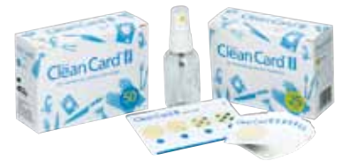
■ Orion Clean Card PRO