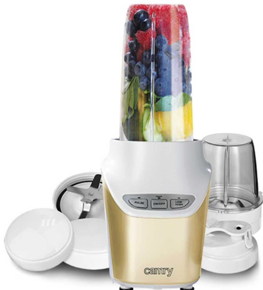
Blender personalny - POWERFUL NUTRI Camry CR 4071