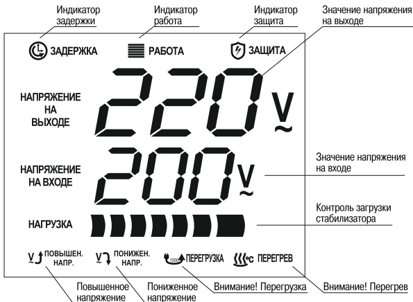
Рис 2. Индикация режимов работы стабилизаторов

Индикация режимов работы на дисплее стабилизатора показана на рисунке 2.