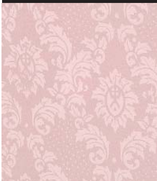
Le Tappezzerie dell'Ottocento - Design Roller TP 15 - OTTOCENTO ANTICO VELLUTO AN 892