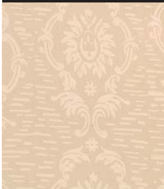
Le Tappezzerie dell'Ottocento - Design Roller TP 10 - OTTOCENTO ANTICO VELLUTO AN 874