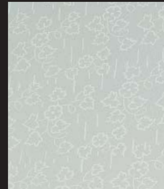
Le Tappezzerie dell'Ottocento - Design Roller TP 20 - OTTOCENTO ANTICO VELLUTO AN 834