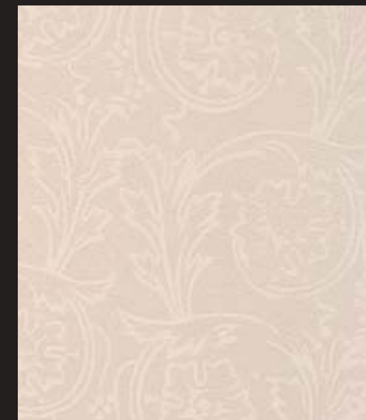
Le Tappezzerie dell'Ottocento - Design Roller TP 25 - OTTOCENTO ANTICO VELLUTO AN 884