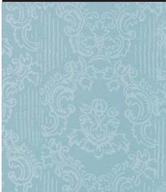
Le Tappezzerie dell'Ottocento - Design Roller TP 05 - OTTOCENTO ANTICO VELLUTO AN 833