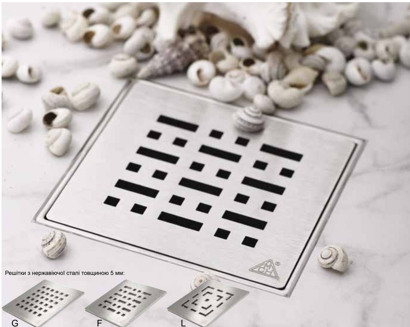
Решітки з нержавіючої сталі товщиною 5 мм: