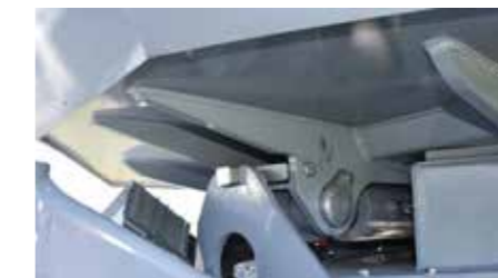
Der Verriegelungsmechanismus sichert die Mulde beim Laden und Fahren.