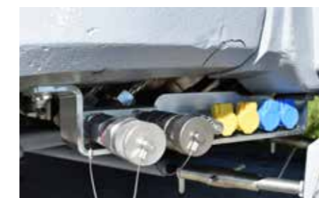
Optionale Powerline für den Anschluss von leistungshungrigem Zubehör