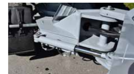
Robustes Zentralgelenk mit Knickwinkel +/- 35° und Pendelwinkel +/- 12°