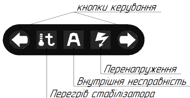
Малюнок 3. Кнопки керування та піктограми несправностей.

Під індикатором знаходяться дві кнопки для доступу до «екранів» з додатковою інформацією (див. табл. 3) і табло з піктограмами, які підсвічуються при виникненні аварійної ситуації (див. мал. 4).