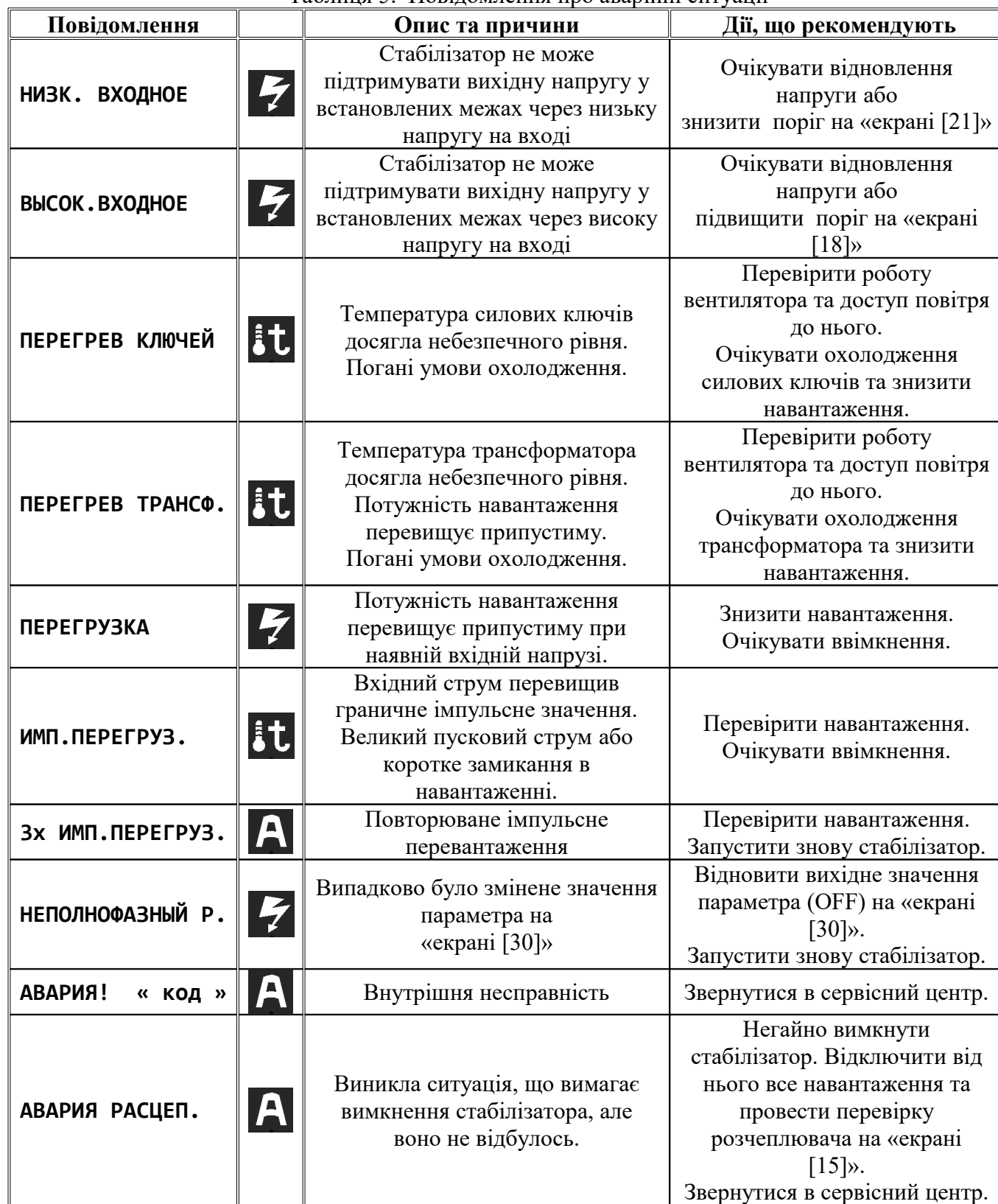
Таблиця 5. Повідомлення про аварійні ситуації

Деякі інші несправності наведені в таблиці 6.