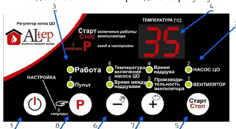
Рисунок 2 – Зовнішній вигляд передньої панелі контролера

6.2 Зовнішній вигляд блока автоматики приведено на рисунку 2.