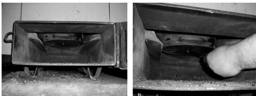
Рисунок 8.1 – Чищення реторти

Мінімум один раз на місяць, а при використанні палива великої зольності – мінімум один раз на два тижні, перевіряти наявність та видаляти накопичення решток шлаку в корпусі пальника. Для цього необхідно відкрутити гвинт, який тримає нижню кришку пальника, зняти кришку, та видалити шлак (див. рисунок 8.1). Після чого встановити кришку на місце.