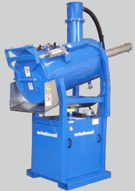
Стационарное исполнение, транспортировочная ходовая часть по запросу