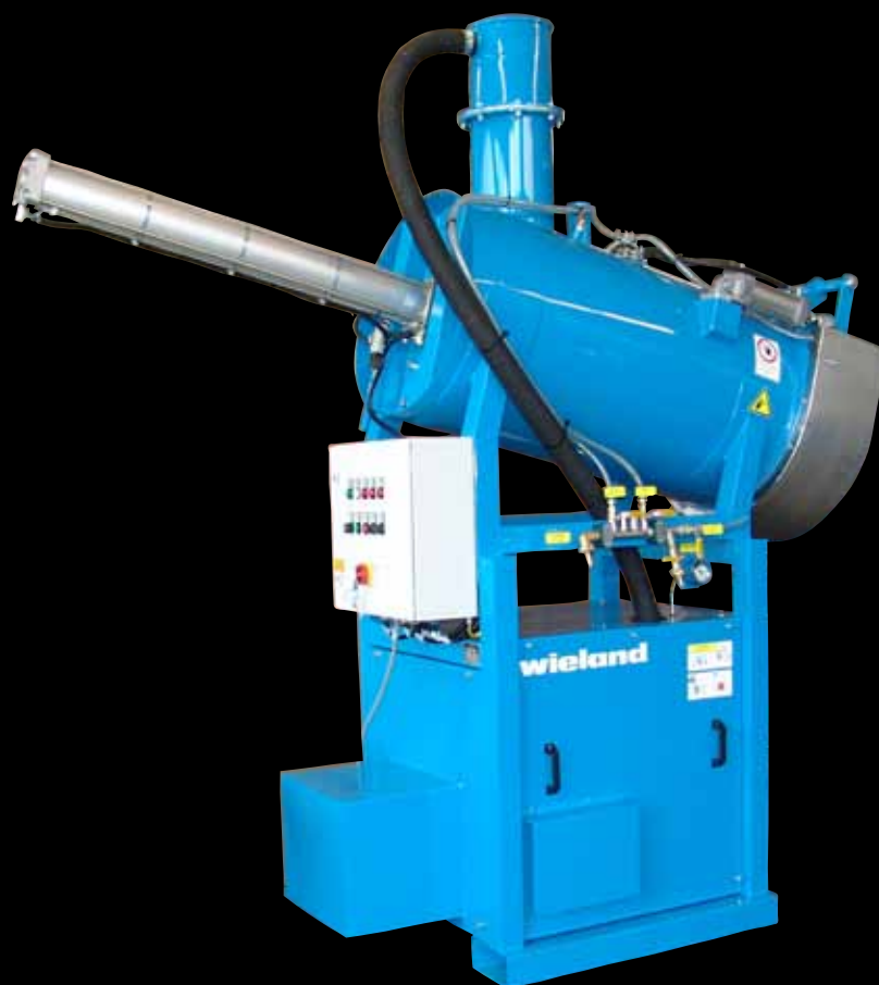
Очиститель смазки и отстойников FA-450