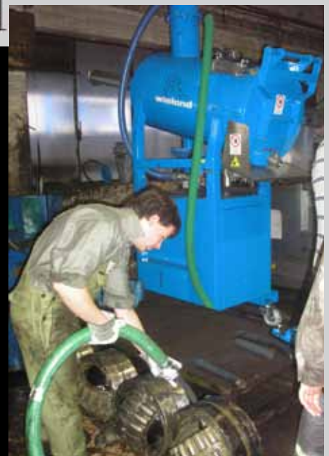
Всасывание смазки из подшипников на металлургическом заводе