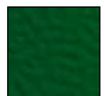
зелений RAL 9006