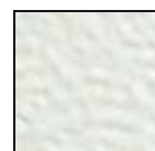
білий RAL 9002

Ворота SMART доступні в трьох стандартних кольорах: RAL 9002 (білий), RAL 9006 (сріблястий), RAL 6005 (зелений). В якості опції доступне фарбування в будь-який колір по RAL.