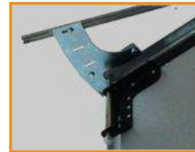
Направляючий трек відкривання на 180°

Ворота SMART доступні в комбонуваннях панелей 2+2, 2+1, 2+0, 1+1. Складання панелей нна 90° (стандарт) та 180° (опція).