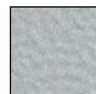
сріблястий RAL 9006