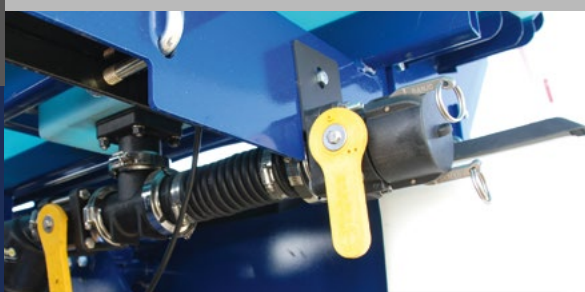
Розташований в нижній частині бака заправний блок забезпечує швидке та безпечне заправлення з рівня землі