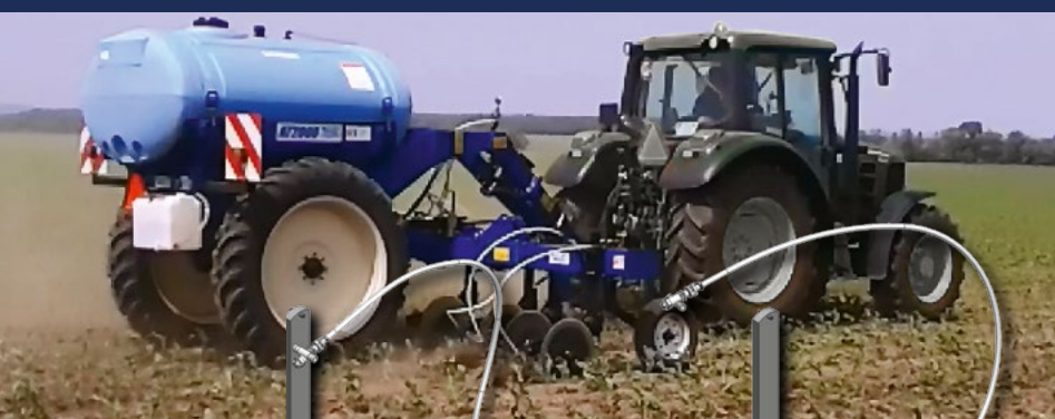
Система внесення рідких мінеральних добрив JetStream