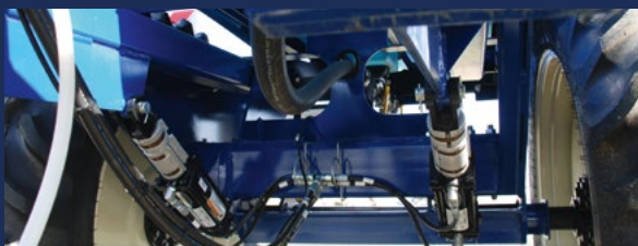
Подвійні підйомні гідроциліндри з проставками для регулювання робочої глибини, гідроциліндри складання бокових секцій