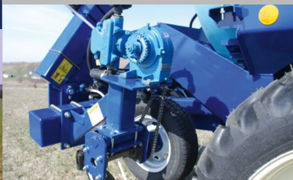
Механічний привід від колеса з шиною 155/80R12, насоси John Blue, розташований знизу заправний блок з рукавом діаметром 50 мм