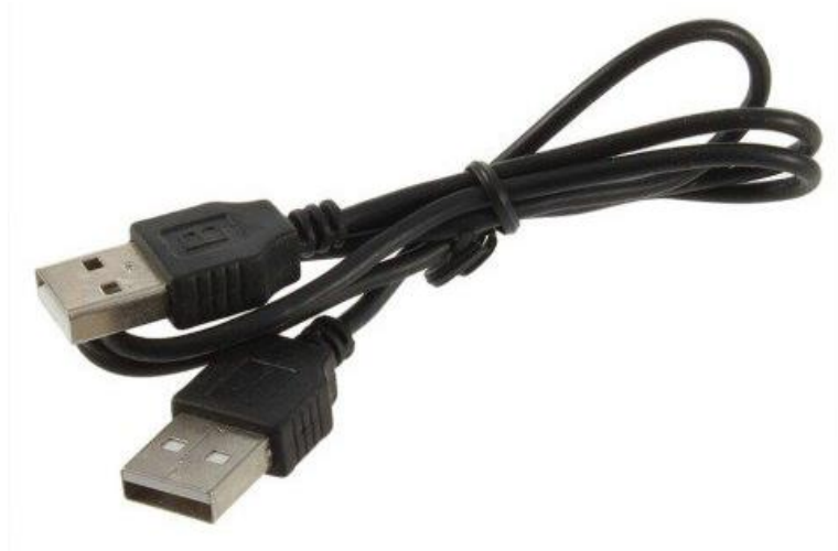
Фото USB OTG кабеля